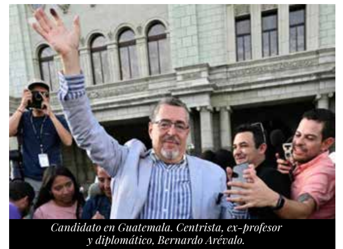
Candidato en Guatemala. Centrista, ex-profesor y diplomático, Bernardo Arévalo.

tados Americanos declaró válidos los resultados de las elecciones y denunció el llamado recuento, diciendo la voluntad de los votantes en una elección democrática que fue observada por los representantes extranjeros independientes deben ser respetada . Guatemala finalmente ha estado saliendo de la prolongada y violenta guerra civil que duró de 1960 a 1996, entre el gobierno y varios grupos de izquierda. Durante la guerra civil las fuerzas gubernamentales de una serie de dictaduras militares fueron responsables de los asesinatos en