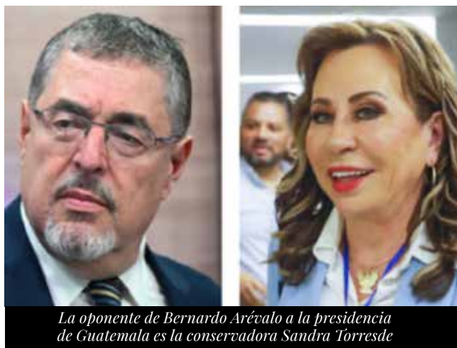
La oponente de Bernardo Arévalo a la presidencia de Guatemala es la conservadora Sandra Torres

Se desempeñó como secretaria del Medio Ambiente en el 2015. Como alcaldesa, Sheinbaum modernizó el sistema de metro de la Ciudad de México, construyó 200 kilómetros de ciclovías en la capital y puso en marcha “Mi Beca” para “Empezar” programa de becas para 1,2 millones de preescolar y estudiantes de secundaria. La rival de Sheinbaum para la candidatura presidencial de Morena es el ex-canciller, Marcelo Ebrard. Sheinbaum fue la primera mujer y persona judía en servir como alcalde de la Ciudad de México.