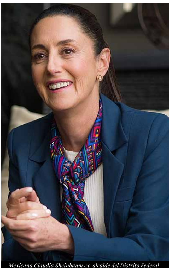
Mexicana Claudia Sheinbaum ex-alcalde del Distrito Federal

Claudia Sheinbaum, alcaldesa de la Ciudad de México desde el 2018, anunció que busca la candidatura presidencial de Morena , partido del presidente de México para suceder al presidente Manuel López Obrador en la votación de 2024. Sheinbaum, de 66 años, dijo que quiere ser la primera mujer en la historia de México en ser presidenta. Morena elegirá su candidato en agosto o septiembre de este año. Sheinbaum tiene un doctorado en ingeniería energética por la UNAM y es autor de muchos artículos y libros sobre el desarrollo sostenible. Ella sirvió en el Panel Intergubernamental sobre el Cambio Climático y es coautor de dos de sus informes.